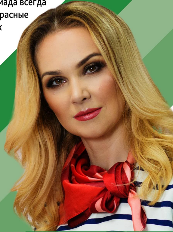
Доцент кафедры экономики и внешнеэкономической деятельности

«К битвам спортивным все мы готовы. Каждый уверен в силе своей. И побеждает на финише снова Дружба, сплоченность команды моей!»