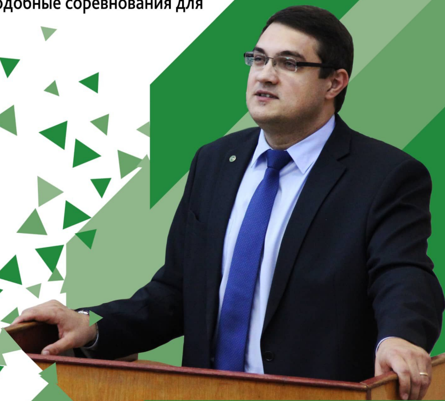
Декан факультета перерабатывающих технологий

Считаю очень важным проводить подобные соревнования для сотрудников.